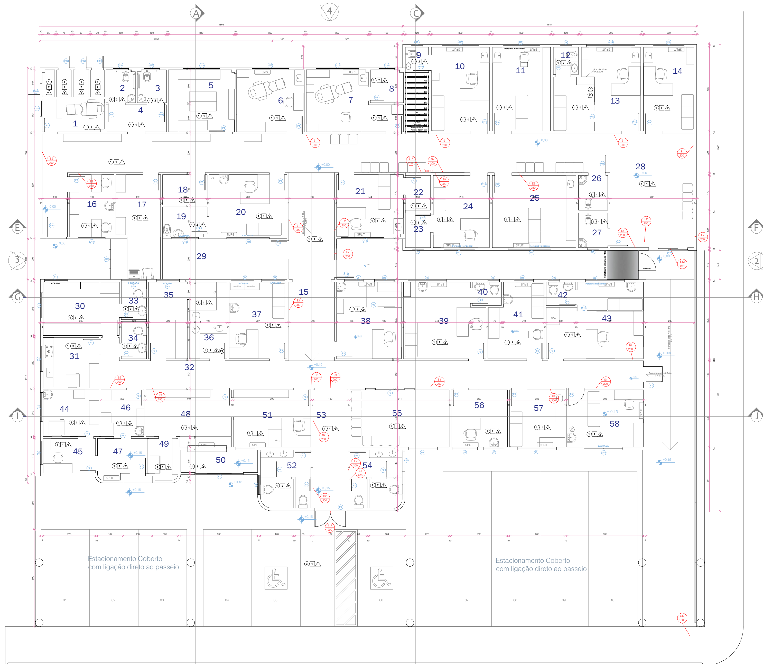
PLANTA BAIXA PAVIMENTO TÉRREO Área = 662,72 m² Esc. 1:100