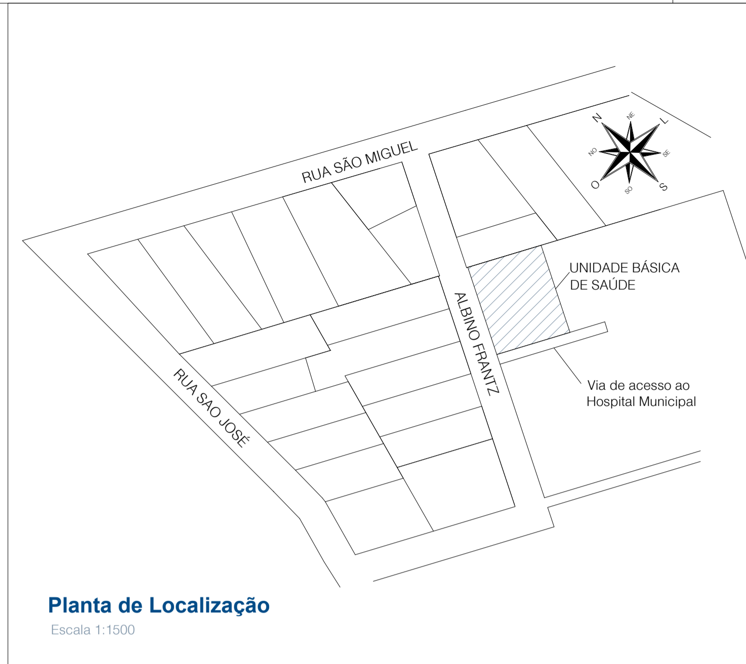
Planta de Localização Escala 1:1500