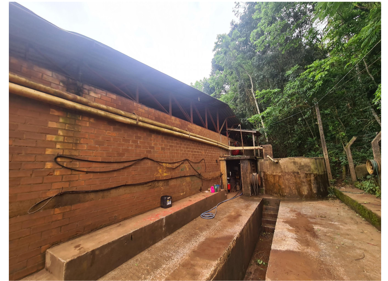
LOCAL DE INTEVENÇÃO Sem escala