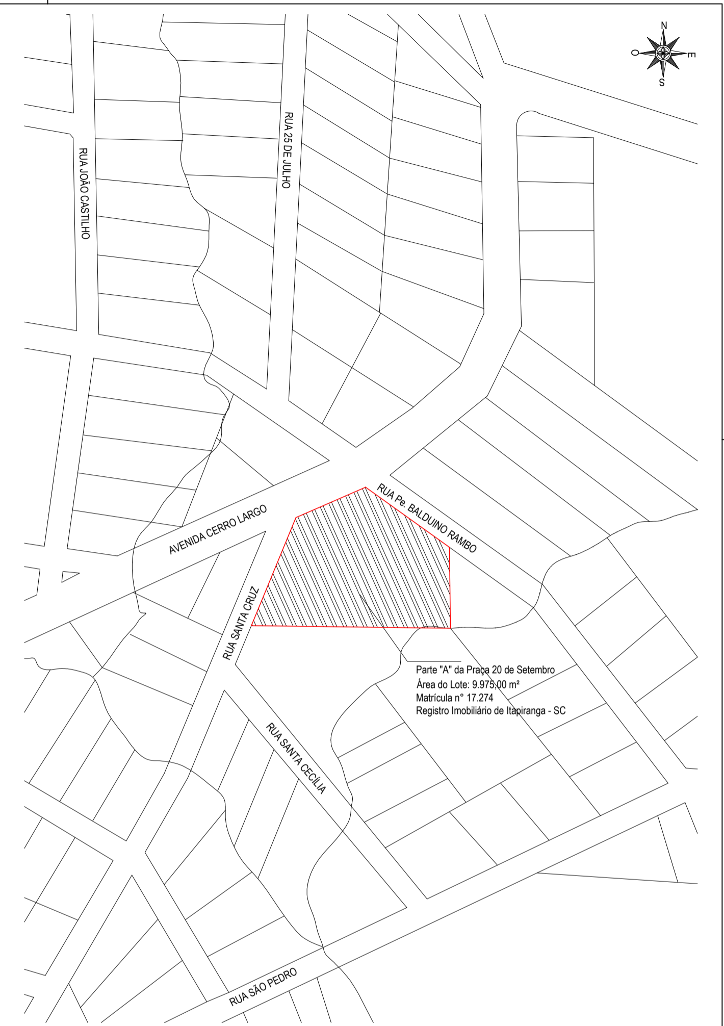
■ PLANTA DE LOCALIZAÇÃO Escala: 1/2000

Parte "A" da Praça 20 de Setembro Área do Lote: 9.979,00 m² Matrícula n° 17.274 Registro Imobiliário de Itapiranga - SC