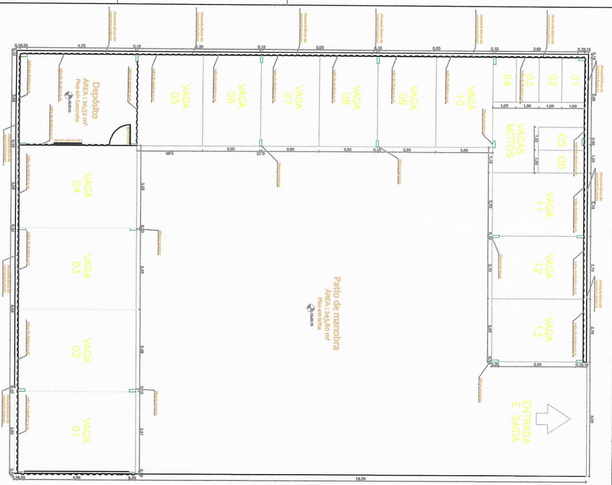
PLANTA BAIXA - ARQUITETÔNICO