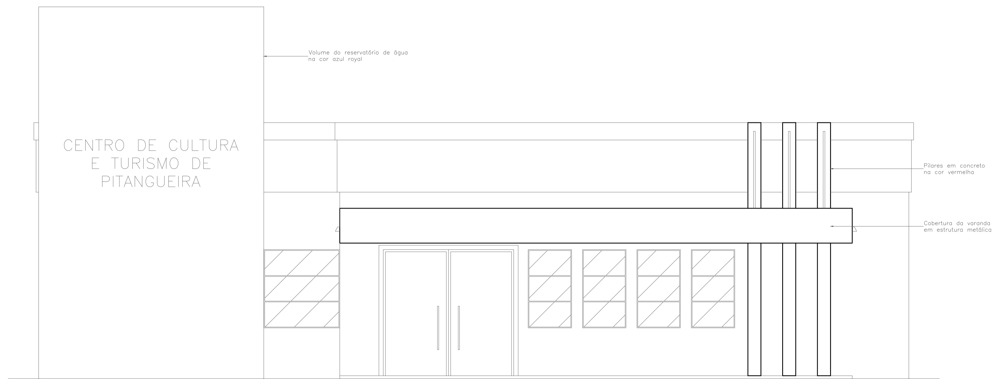
FACHADA LESTE Esc.:1:50