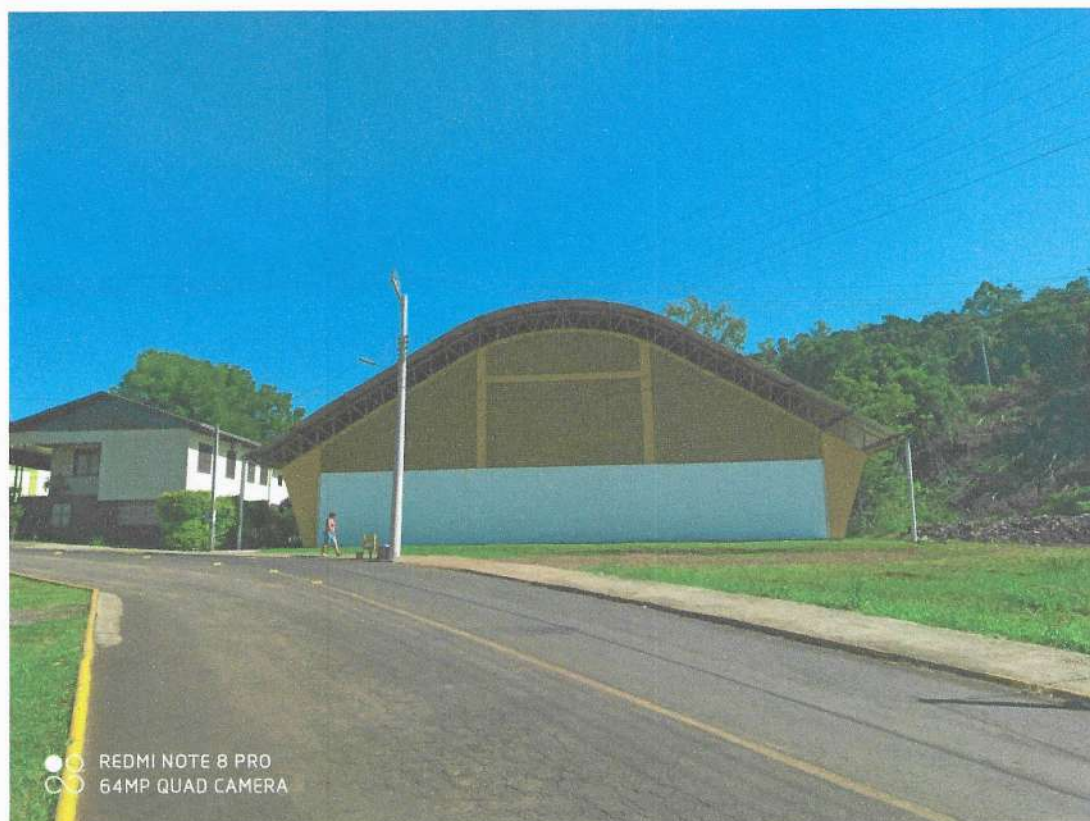
Figura 01: foto da fachada do ginásio amarelo FNDE.

A estrutura se encontra em bom estado de conservação, as tesouras metálicas estão espaçadas conforme as normas técnicas, o alinhamento do telhado se encontra em perfeito nível, as telhas estão em bom estado de conservação. Nota-se que não se encontra nenhuma infiltração e não há indícios em relação a pontos críticos que apresentem sinais de ruptura ou desgaste, conforme fotos em anexo.