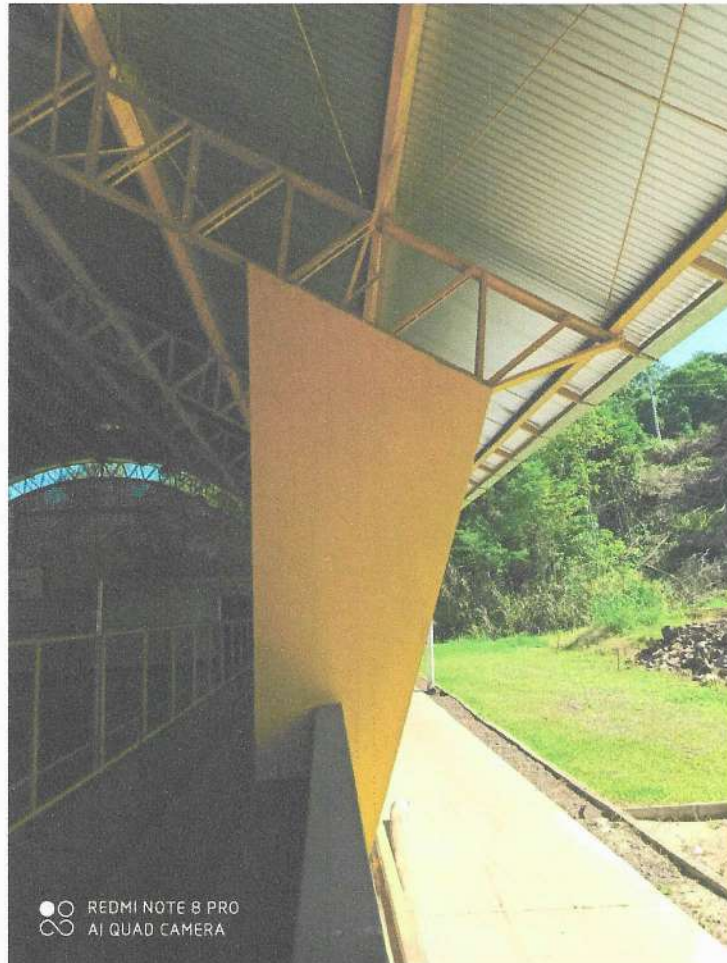
Figura 02: Sistema de engastamento da estrutura do telhado.