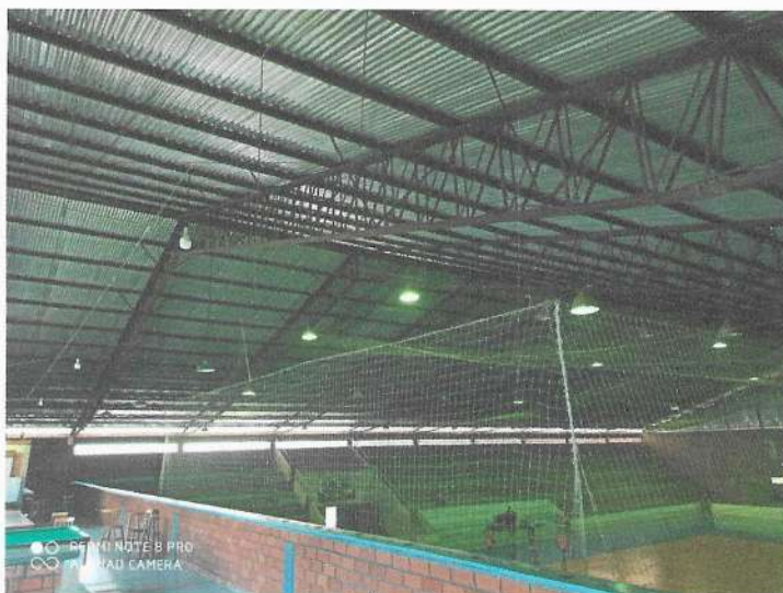
Figura 03: Vista geral da cobertura do telhado do ginásio.