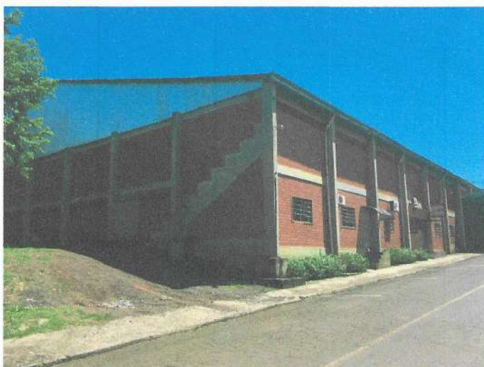
Figura 01: foto da fachada do ginásio municipal Casildo Froelich.

A estrutura aparentemente, se encontra em bom estado de conservação, as tesouras metálicas estão espaçadas conforme as normas técnicas, o alinhamento do telhado se encontra em perfeito nível, as telhas estão em bom estado de conservação. Nota-se que não se encontra nenhuma infiltração e não há indícios em relação a pontos críticos que apresentem sinais de ruptura ou desgaste, conforme fotos em anexo.