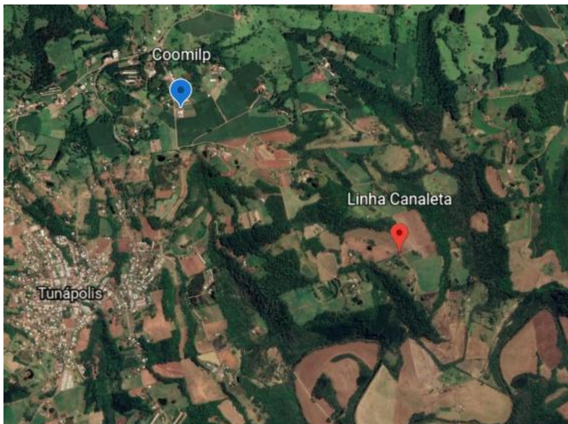
Figura 1 - Mapa de localização - Canaleta.